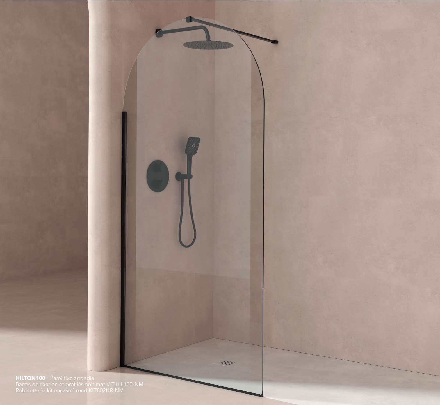
HILTON100 - Paroi fixe arrondie Barres de fixation et profilés noir mat KIT-HIL100-NM Robinetterie kit encastré rond KIT802HR-NM

Verre transparent SECURIT 8 mm traité anti-calcaire