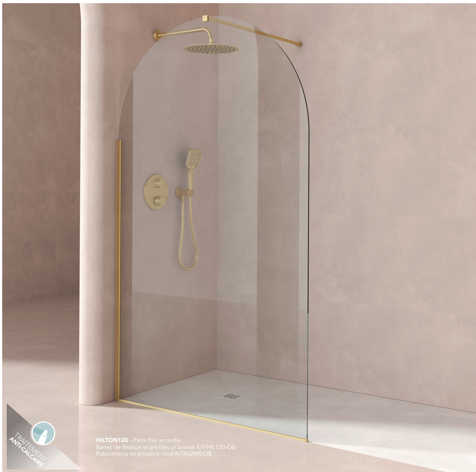
HILTON120 - Paroi fixe arrondie Barres de fixation et profilés or brossé KIT-HIL120-OB Robinetterie kit encastré rond KIT802HR-OB